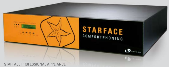
STARFACE PROFESSIONAL APPLIANCE

Stellen Sie Ihr Unternehmen auf eine kostengünstige Zukunft mit Voice-over-IP ein: mit STARFACE APPLIANCE. Das innovative Komplettpaket wurde speziell für den Mittelstand entwickelt. Ihre Niederlassungen, Vertriebsbüros und Telefone im Außendienstesatz können in Ihre zentrale STARFACE Telefonanlage integriert werden. Das Hard- und Software umfassende Angebot besteht aus aufeinander abgestimmten Komponenten und ermöglicht Ihnen den schnellen und besonders einfachen Zugang zur IP-Telefonie. STARFACE APPLIANCE – einfach anschließen und sofort telefonieren!